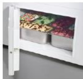
REFRIGERATED RESERVE CELL